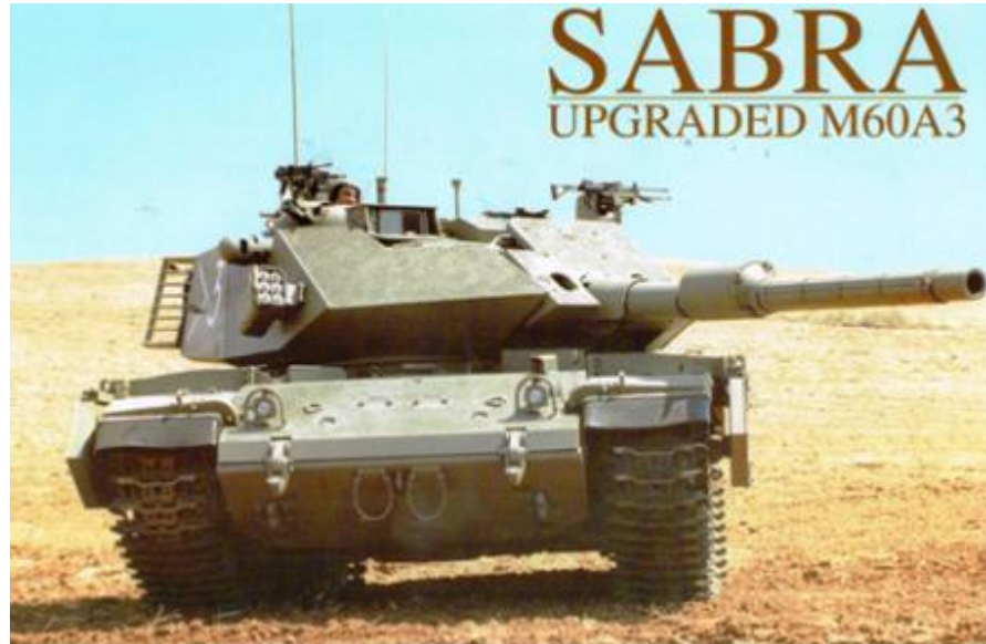
תמונה מס' 6- גרסה ראשונה של הטנק המושבח

כשהשתחררתי נקלטתי בתעש והנושא המרכזי במפעל "סלבין" ( מערכות יבשה ) אותו קידמתי היה פיתוח ושיווק טכני ומבצעי של השבחת טנקי ה M60A3 של הצבא הטורקי (ראה על ההשבחה בהמשך). כאשר ביקשנו להשאיל מצה"ל טנק לפיתוח הדגם הראשון הוקצה לנו טנק מסוים.שלחנו מכונאי למחנה של מחסני החרום במחנה עופר להביא אותו. המכונאי צלצל אלי ואמר לי שהטנק לא מניע ואם לא אכפת לי שיביא טנק אחר. אישרתי לו להביא כל טנק אחר זמין.כאשר הגיע הטנק לתעש ראיתי שיש עליו ריתוכים של תיקון פגיעות שהזכירו לי את הטנק האישי שלי מיום הכיפורים. בערב בדקתי את מספר "ה-צ" שלו ואז התברר לי שטנק המלחמה "שלי" ( צ-817701 ) חזר שוב לפעילות למשך מספר שנים.לימים יצאתי לתערוכה בטורקיה עם הטנק, לתערוכת יורוסטורי בצרפת ב 1998 (בדיוק 25 שנה מהמלחמה) וגם הטנק הוצב בתערוכת היובל של המדינה בגני התערוכה."