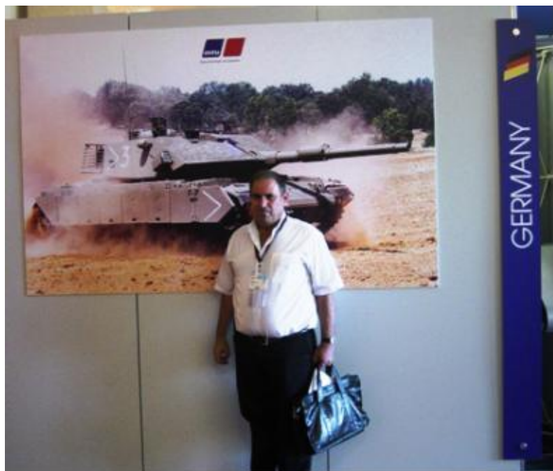
תמונה מס' 11- ה"טנק" כפי שמופיע באתר הרשמי של חברת MTU הגרמנית ספקית המנוע לטנק התורכי.

הערה: ניתן להבחין שבכל התצורות נשמר הסימון הטקטי של הטנק המקורי מיום הכיפורים.