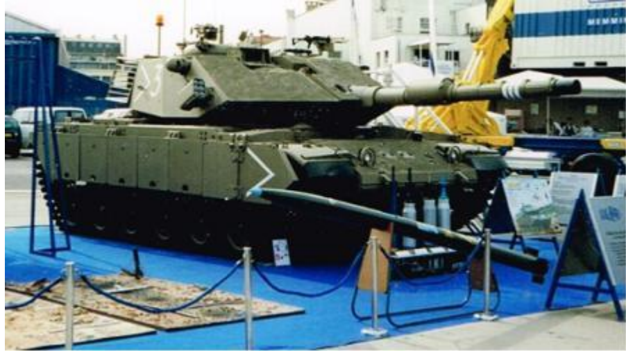
תמונה מס' 8-ה"טנק" המושבח בתערוכה בפריז.