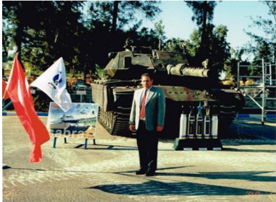
תמונה מס' 9-ה"טנק" המושבח מוכן לתצוגה לרמטכ"ל תורכיה בתעש.