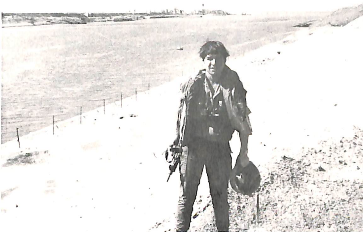
כמפקד מחלקת טנקים — על גדות התעלה