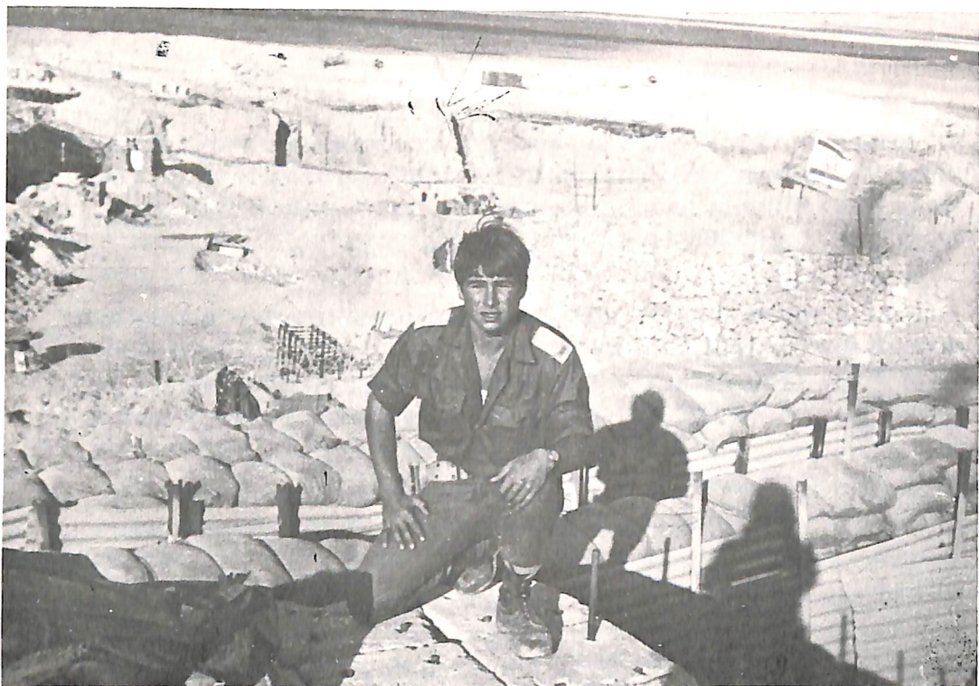
במעוז על גדות התעלה