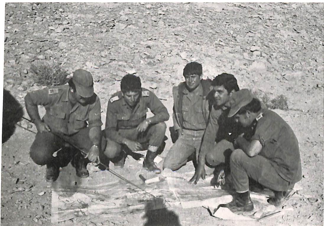
אתנחתה לתדרוך עם חברים לפלוגה