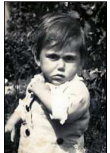
איך שהזמן רץ....