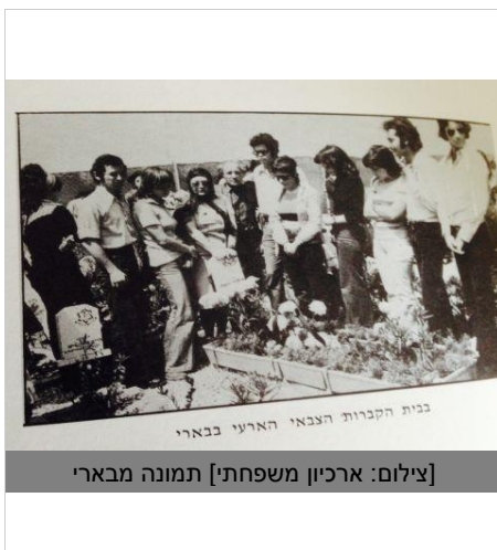
תמונה מבארי

כמדי שנה ערב יום הכיפורים אני מכין עבורך סקירה על המתרחש. 43 שנים מאז נורת ליד הטנק ממנו קפצת בחולות סיני בסמוך לצומת "טרטור-לקסיקון". 43 שנים מאז התקשרתי הביתה מאי שם על גדות התעלה ואחי אמר לי "אתה בטח יודע מוישה איננו". לחמנו כמעט כתף ליד כתף. טנק ליד טנק אבל לא ידעתי מה עלה בגורלך. תמיד חשבתי שהיכולת הפנומנלית שלך להסתדר בכל מצב תשאיר אותך בחיים. חשבתי וטעיתי .