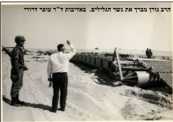
הרב גורן מברך את גשר הגלילים.

כולנו – לוחמי חטיבה 600 ומפקדיהם – רשאים ויכולים להתגאות בביצוע כל משימותינו וגם בביצוע משימות של חטיבות אחרות, על הצד הטוב ביותר.