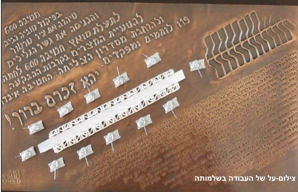
צילום-על של העבודה בשלמותה