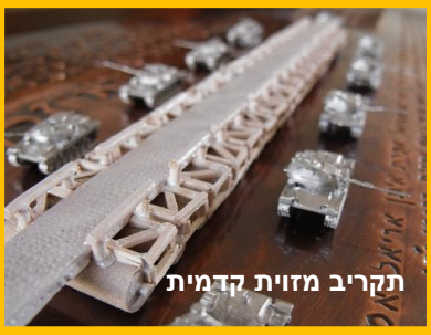
תקריב מזווית קדמית

עם קצת מזל, העבודה תמוסגר עד יום הזכרון ותוצג לחברים בטקס בלטרון ביום הזכרון. בלי נדר.